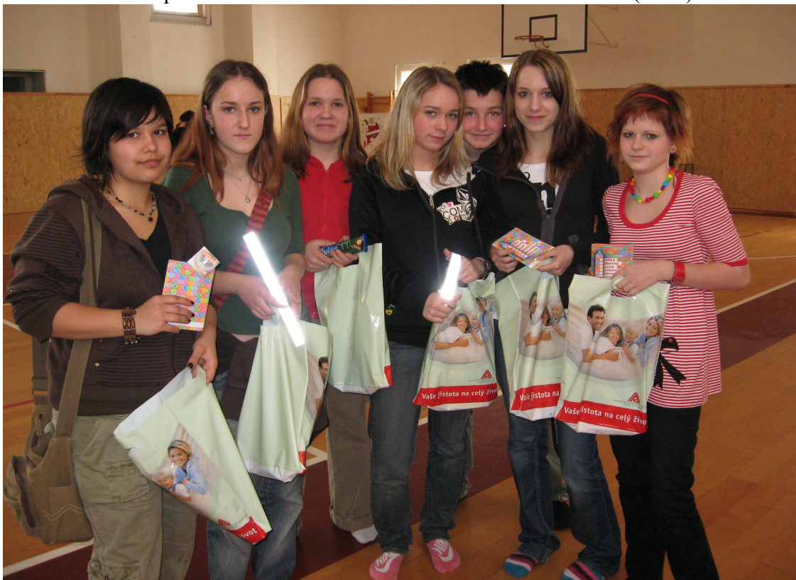
(vítězná skupina z 9.A ze ZŠ Družstevní)