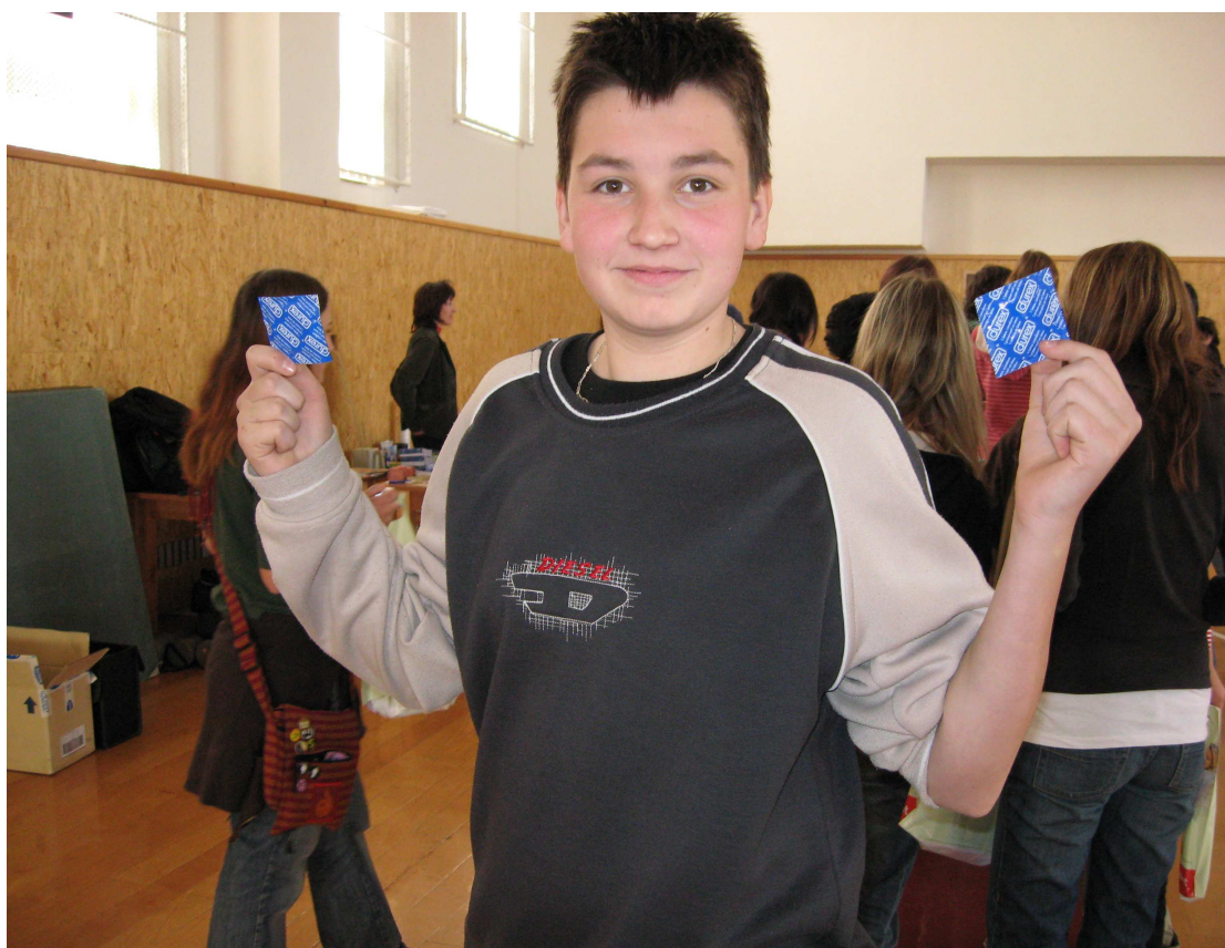
(někteří účastníci obdrželi svůj první kondom)