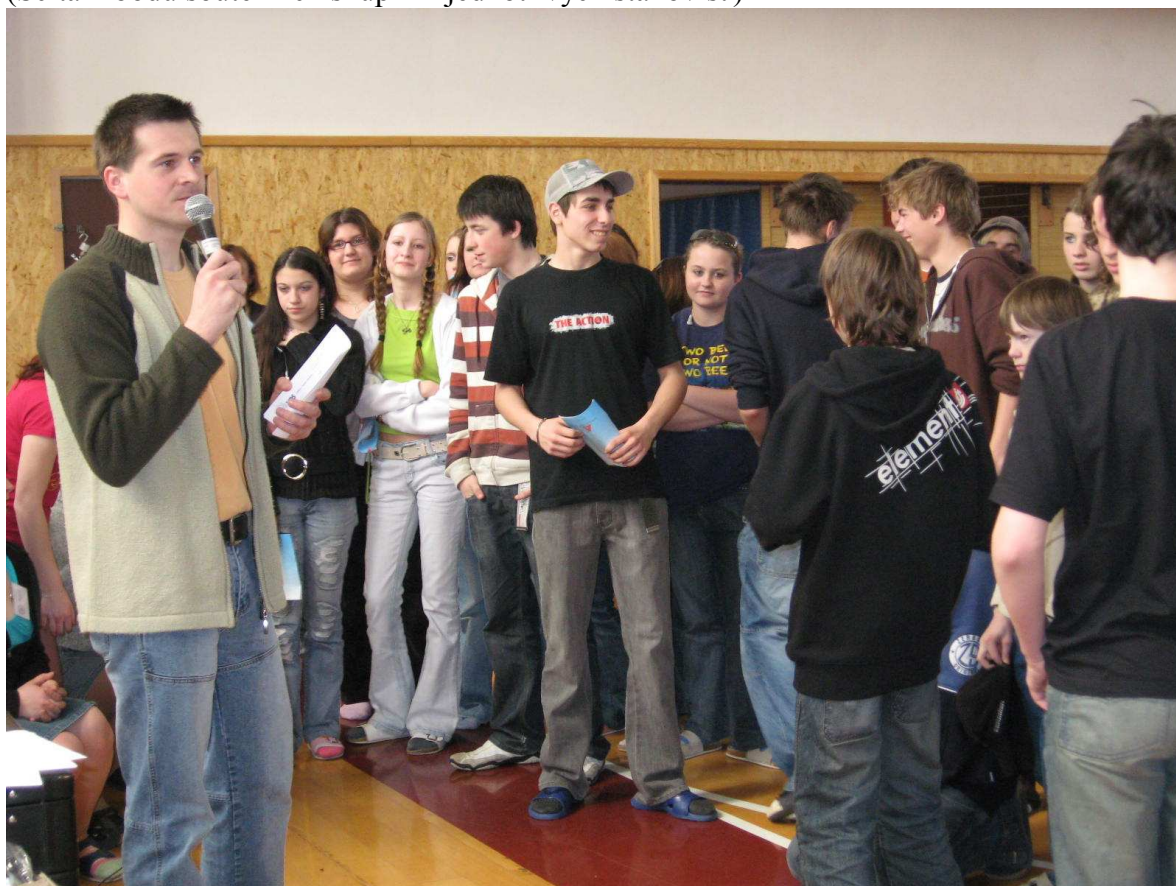
(Jiří Stupka při vyhlásování vítězů)