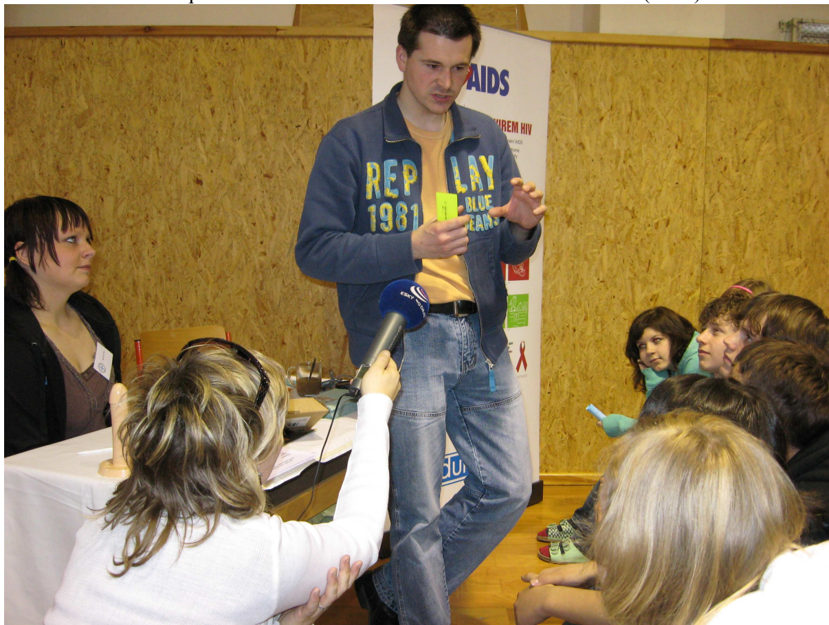
(akce zaujala Český rozhlas, který si přijel natočit živou reportáž)