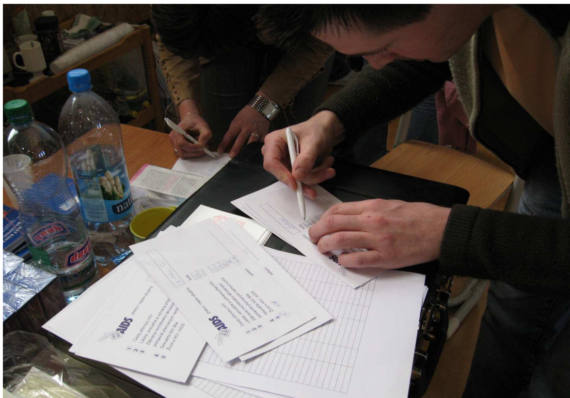
(Sčítání bodů soutěžních skupin z jednotlivých stanovišť)