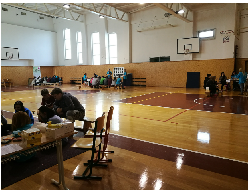
Skupinová práce na střídajících se stanovištích