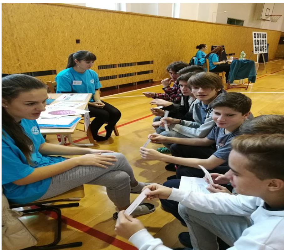
Žáci reagují na evaluační otázky a odpovídají na téma přenosu a ochrany před papilomaviry