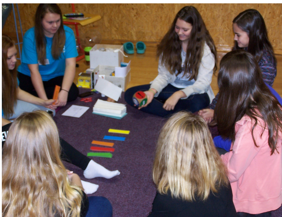
Žáci odpovídají na otázky z oblasti vztahů a sdílí své názory