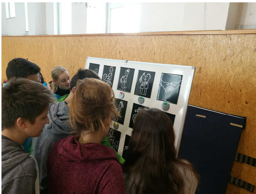
Žáci ZŠ nastavují barevné terčíky podle rizika přenesení viru