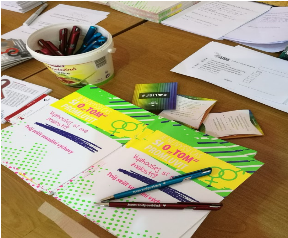
Propisky s logem „Jsem zodpovědný“, pracovní sešit, edukační kondom,...