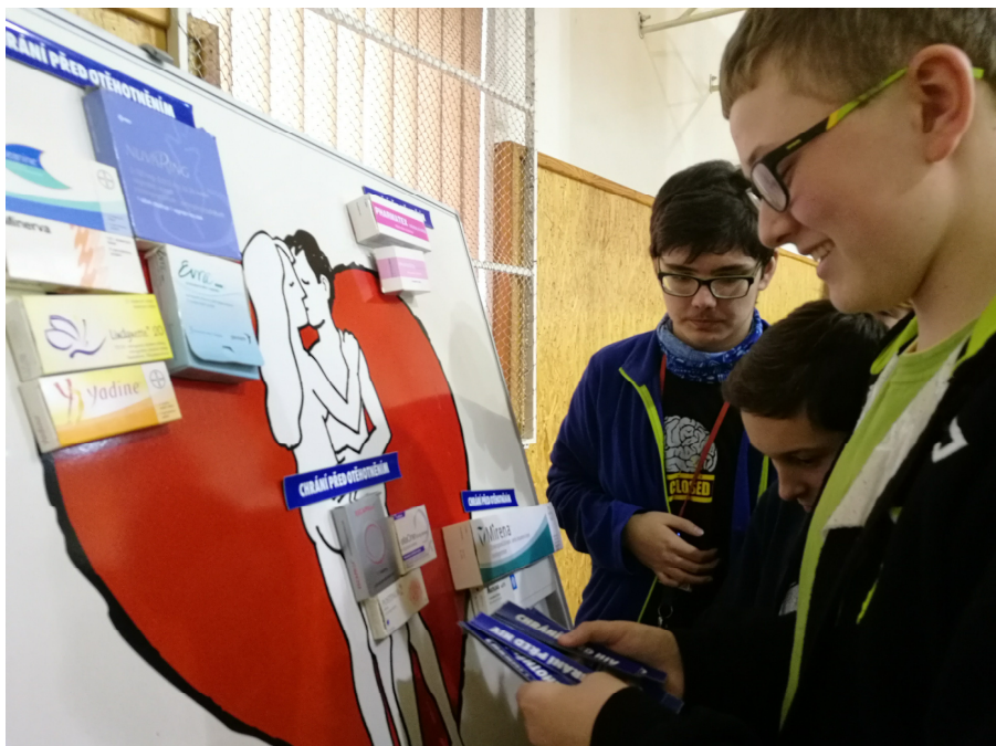
Žáci ZŠ se zamýšlejí, které formy antikoncepce (ne)chrání před HIV